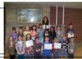
Ganadores del Spelling Bee 2011