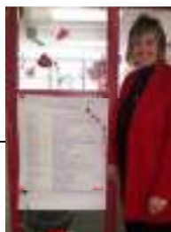
Nuestros mejores deseos a la Sra. Thompson.