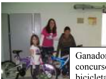
Ganadores del concurso ISAT con sus bicicletas

Feria de la Salud y Seguridad de Niños en McHenry County College 3- 8-11 de 9-4. Se ofrecen a bajo costo exámenes físicos, exámenes dentales y vacunas. Para más información llame al: 815-334-4500.