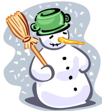
Caption describing picture or graphic.

Much of the content you put in your newsletter can also be used for