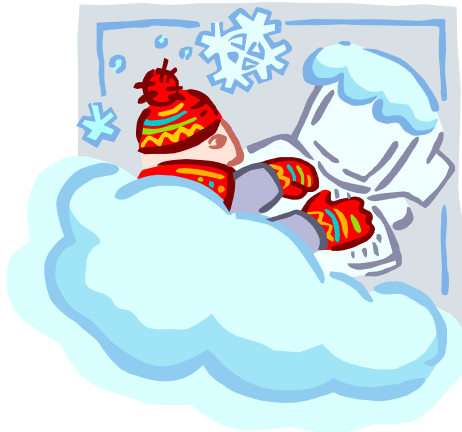
Caption describing picture or graphic.

If space is available, this is a good place to insert a clip art image or some other graphic.