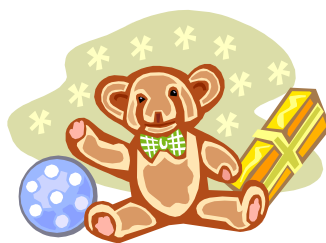
Caption describing picture or graphic.

Think about your article and ask yourself if the picture supports or enhances the message you’re trying to convey. Avoid selecting images that appear to be out of context.